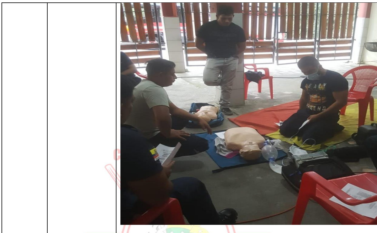
CAPACITACIÓN DE RECATE TÉCNICO CON CUERDA

Desde el 30 de noviemb e al 01 de diciembre del 2020